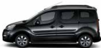
ЧЕРНЫЙ ОНИКС (O)