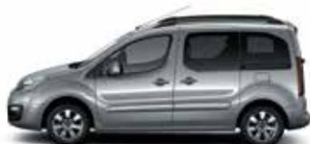
СЕРЫЙ СТАЛЬНОЙ (M)