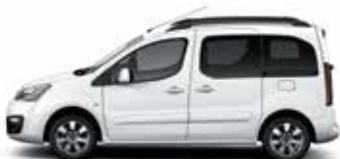
БЕЛЫЙ ЛАК (O)