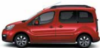
ЖГУЧИЙ КРАСНЫЙ (O)