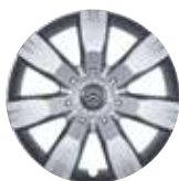
16-дюймовый колпак RANGIROA