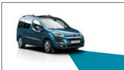
СТАТИЧЕСКОЕ ОСВЕЩЕНИЕ ПОВОРОТОВ

Противотуманные фары с функцией статического освещения поворотов создают дополнительный световой луч, который освещает внутреннюю часть поворота или перекрестка, что улучшает видимость и позволяет вовремя обнаружить препятствия.