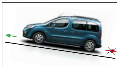
СИСТЕМА ПОМОЩИ ПРИ ПОДЪЕМЕ

Противотуманные фары с функцией статического освещения поворотов создают дополнительный световой луч, который освещает внутреннюю часть поворота или перекрестка, что улучшает видимость и позволяет вовремя обнаружить препятствия.