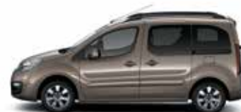
КОРИЧНЕВЫЙ ОРЕХ (M)