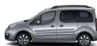
СЕРЫЙ МЕТАЛЛИК (M)

Цвета доступны в зависимости от комплектации