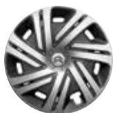
15-дюймовый колпак AIRFLOW