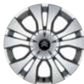
16-дюймовый диск TIKENAU