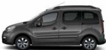
КОРИЧНЕВЫЙ МОККО (N)