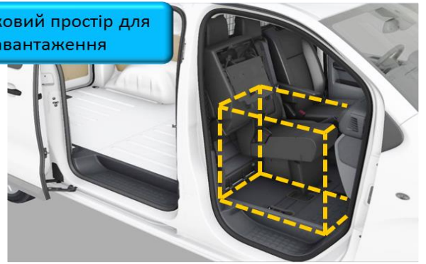
Додатковий простір для завантаження