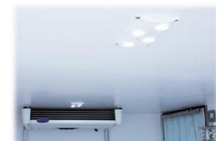
Світлодіодний світильник з перемикачем всередині кабіни