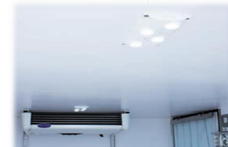
Світлодіодний світильник з перемикачем всередині кабіни

* Всі зображення автомобіля, кузова та салона наведені як приклад і можуть відрізнятися від фактичного